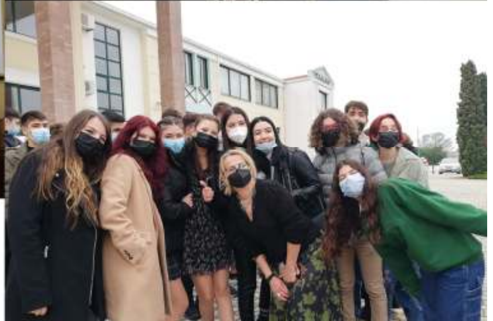
Aristotelio School Serres - Hellas